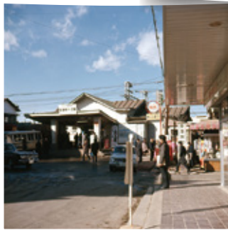
3 昭和44年1月の聖蹟桜ヶ丘駅