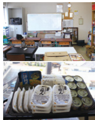
【写真上】慈有塾の学びの場。【下】生活用品や食品、文具、教材などが寄付によって揃う。