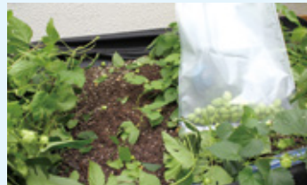
【写真上】「明星大学 × せいせき ホップ育成プロジェクト」のメンバー。【中】手塩にかけて育てたホップを収穫中の学生の皆さん。「毎日の水やりは大変だったけど、元気に育ってくれて嬉しい」と笑みが溢れた。【下】収穫したホップ。目指すはオリジナルビールの完成。