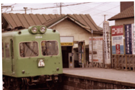
2 昭和44年4月18日の聖蹟桜ヶ丘駅