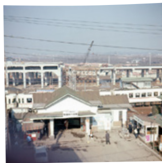
4 昭和44年1月推定 聖蹟桜ヶ丘駅の高架化工事