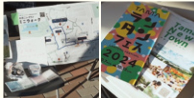
【写真上】ベトナムランタン200個が異国情緒を演出した「J Smile 多摩八角堂」。「中」期間中の地域の商店街の様子。「下」ミニウォーク出展の様子。