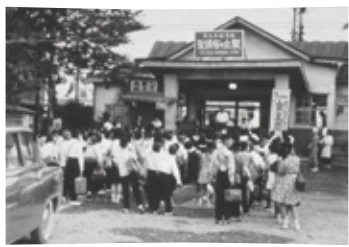
5 昭和43年頃の聖蹟桜ヶ丘駅