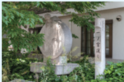
一ノ宮渡しの跡碑