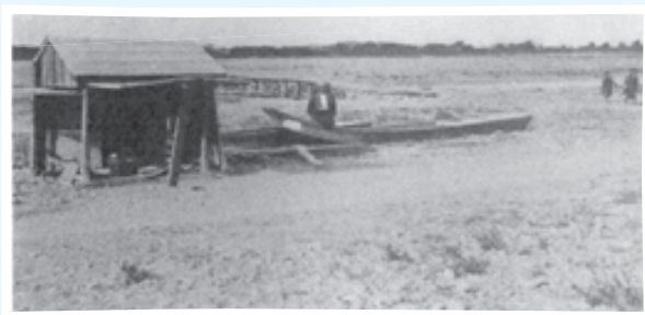
資料:多摩市史 通史編2『関戸渡船場』 ©多摩市デジタルアーカイブ

現在でも関戸橋北詰の近くには「中河原渡し碑」が設置され、右の写真のように、聖蹟桜ヶ丘駅から5分ほど歩くと多摩市側に立つ標柱(一ノ宮渡しの跡碑)がある。