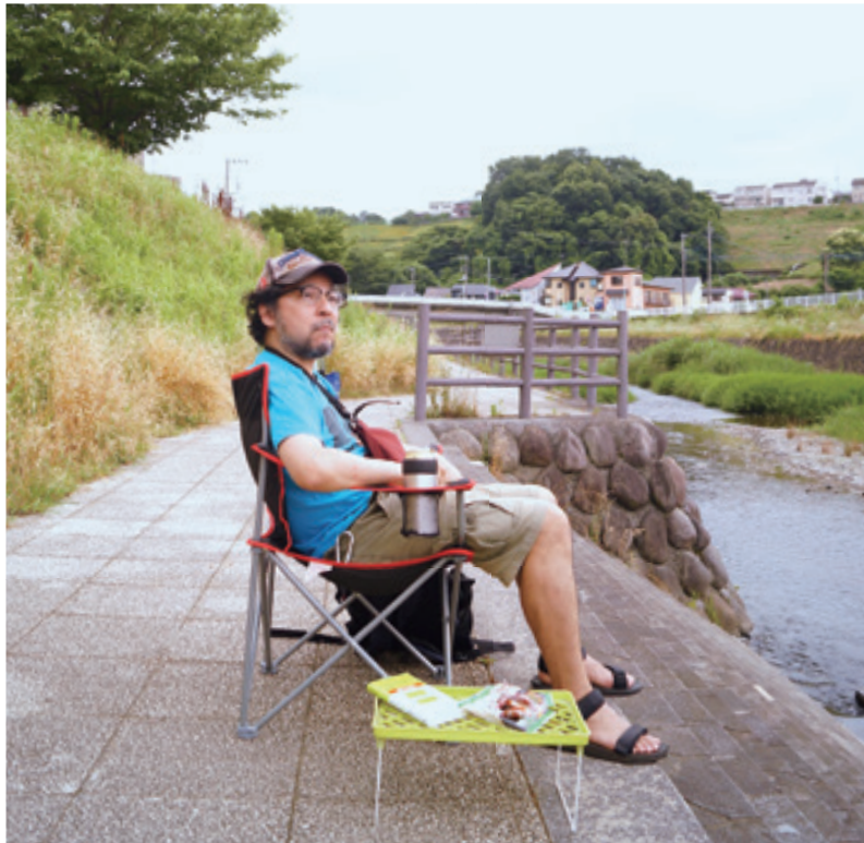
※川に入る際は、安全に注意して行ってください。

Interview, Text : Akira Andoh